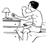
Wake up at Night