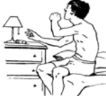
Despertar en la Noche